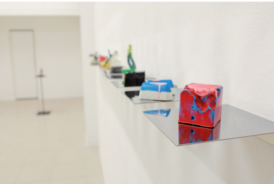
Ruggero Baragliu pastiche#0