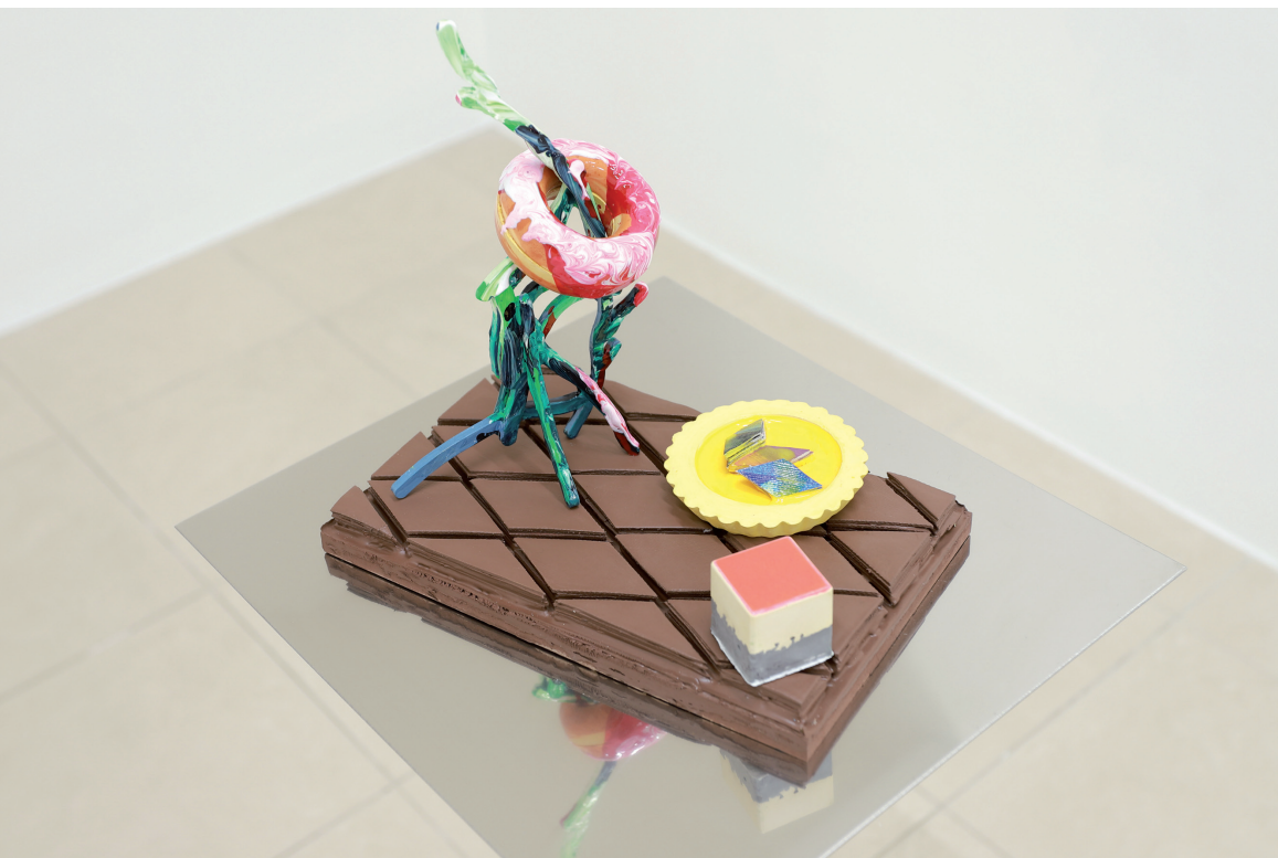
Samuele Pigliapochi pastiche%20