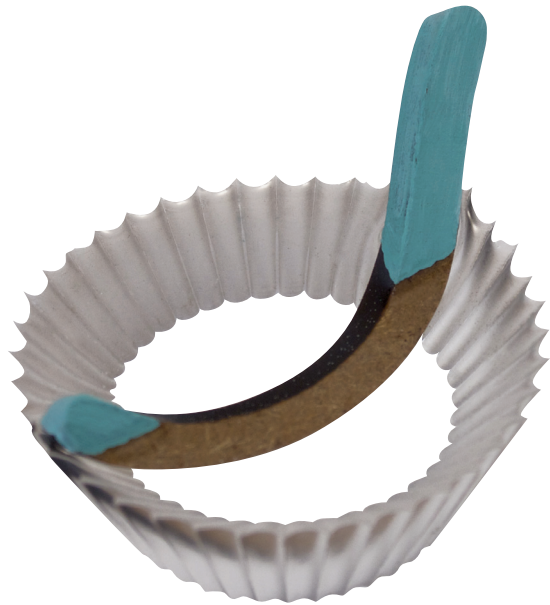
Ruggero Baragli, pastiche#1, mdf, resina bicomponente, colore acrilico, 4x3 cm, 2020