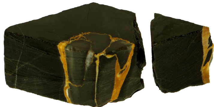
Angelo Spatola, pastiche *7, marmo portoro e olio di lino, 4,5x8x2,5 cm, 2020